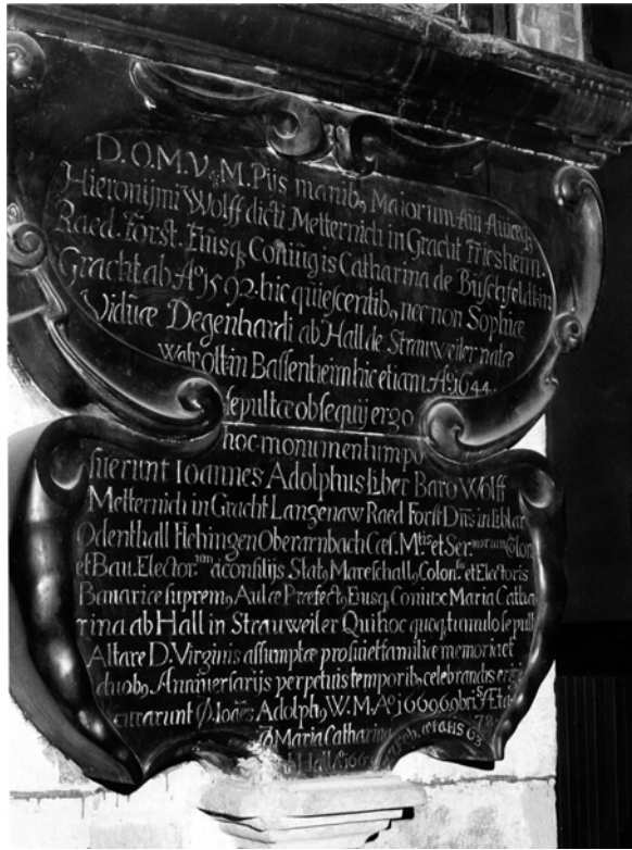
Epitaph in der Kölner Kirche St. Aposteln