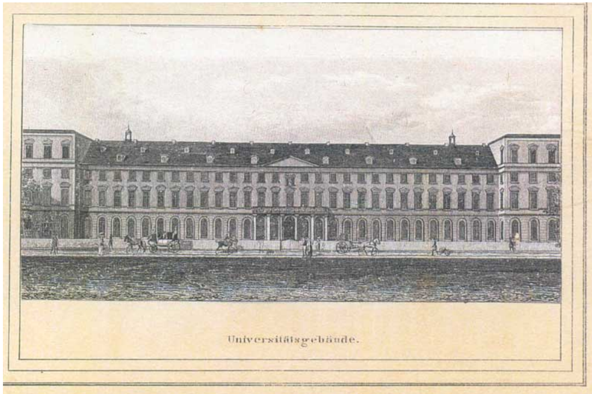
Hauptgebäude der Universität Bonn

Ab dem Wintersemester 1847/48 studierte Carl Schurz als „ vollgültiger, ebenbürtiger Student “ die Fächer Geschichte und Philologie an der Bonner Universität mit dem Ziel, Geschichtspräsident zu werden. Sehr weit kam er bei diesem Vorhaben allerdings nicht, da er aufgrund seines politischen Engagements seit dem Frühjahr 1848 höchstwahrscheinlich nicht mehr die Zeit fand, Vorlesungen zu besuchen. Seine Freunde betrachteten es jedenfalls als seltene Ausnahme, wenn sie ihn in einem Hörsaal antrafen.