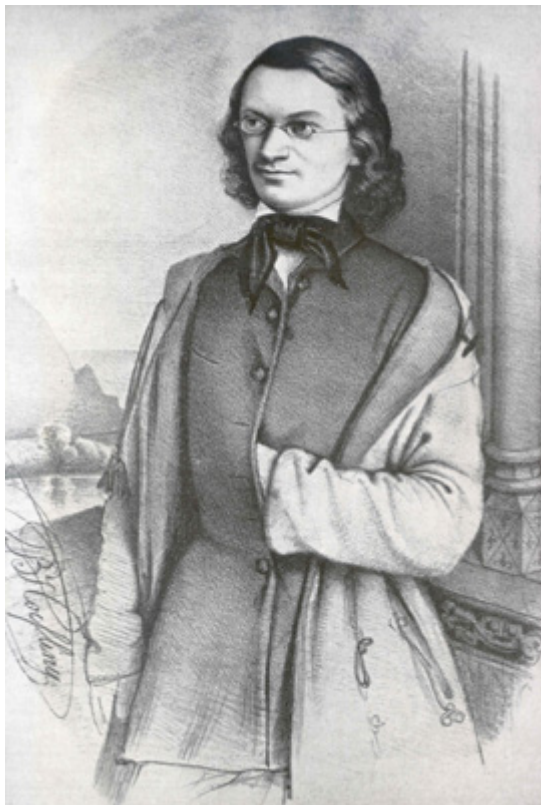
Carl Schurz als Bonner Student

Durch Flugblätter, Vorträge und Reden versuchten Kinkel, Schurz und einige seiner Mitstreiter ihrerseits das Interesse an Demokratie und Republik vor allem bei der Landbevölkerung zu wecken. Über die Resonanz, die sie dort erfuhren, berichtete Schurz: “Wir Studenten erfreuten uns bei der Landbevölkerung einer sehr großen Popularität, und selbst von seiten derjenigen, die nicht mit uns derselben politischen Richtung huldigten, ward uns allenthalben eine freundliche Aufnahme ...“ .