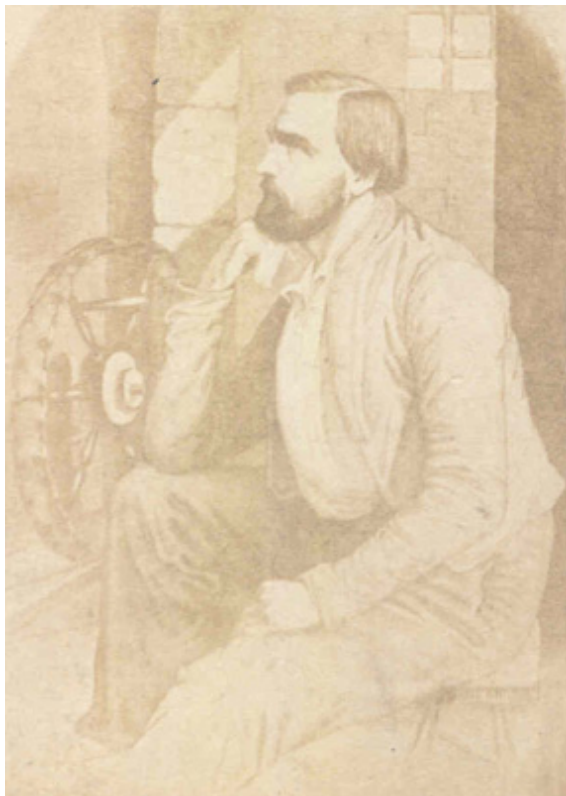
Der inhaftierte Gottfried Kinkel